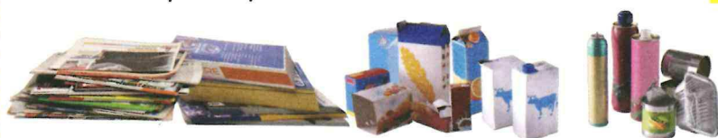
Papiers, cartons d'emballages, briques alimentaires

Les emballages sont à déposer en vrac dans les bornes d'apport volontaire