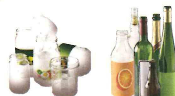
Bouteilles, pots et bocaux en verre